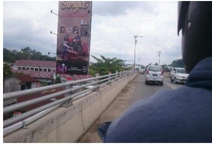
Gambar 2 Ruas Jalan AW Syahrani